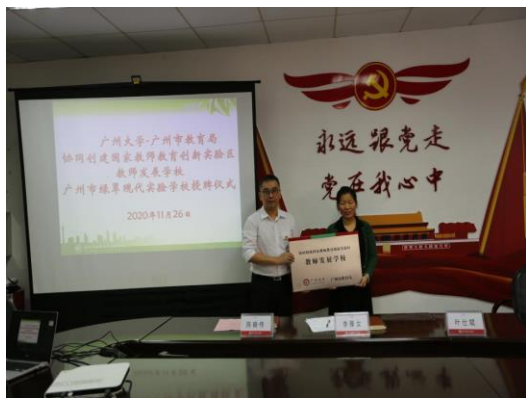
2020. 11. 26 与绿翠现代实验学校合建国家教师教育创新实验区教师发展学校