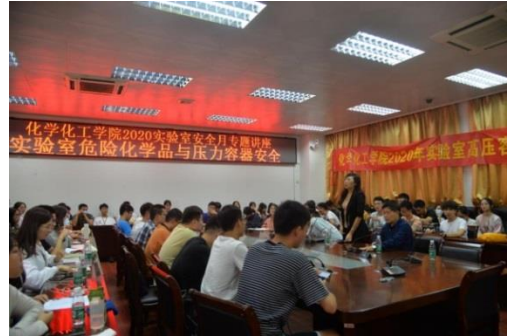
2020. 10. 20 举办《实验室危险化学品与压力容器安全》专题讲座