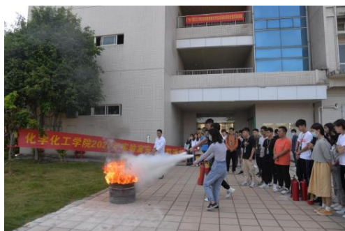
2020. 10. 20 举行实验室消防演练培训