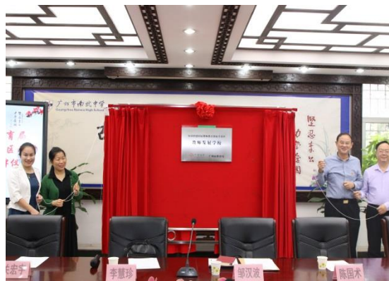
2020. 12. 26 与南武中学合建国家教师教育创新实验区教师发展学校