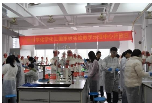
2020. 12. 15 举办化学化工国家级实验教学示范中心开放日