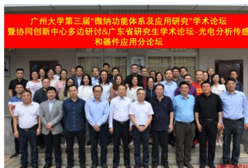
2020. 11. 3-5 举办第三届“微纳功能体系及应用研究”学术论坛